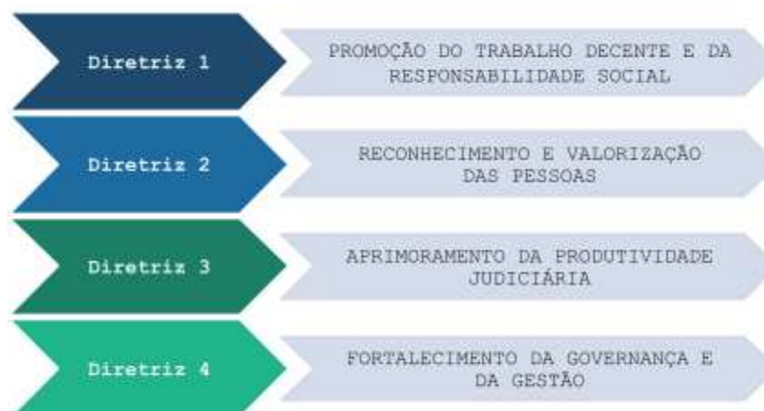
Figura 3 – Diretrizes da Gestão 2023-2024

Para dar materialidade a essas diretrizes, foram priorizadas um conjunto de iniciativas a serem implementadas no período de 2023 a 2024 para assegurar a realização dos objetivos institucionais, consoante metas fixadas no Plano Estratégico do TRT8.