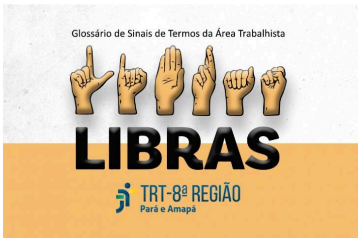
Foto 7: Cada vez mais empenhado na questão da acessibilidade, o Tribunal Regional do Trabalho da 8ª Região (TRT-8) não tem medido esforços para garantir a prestação de um serviço público inclusivo e humanizado. Um dos resultados práticos desta tentativa é o Glossário de Sinais de Termos da Área Trabalhista, produzido por

alunos do curso de Libras (Língua Brasileira de Sinais) oferecido pelo TRT-8. Os alunos são servidores atuantes em diferentes setores do Tribunal que demonstram, no vídeo, como comunicar variados termos da área trabalhista em Libras.