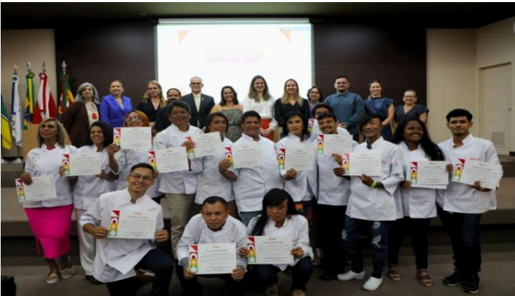
Foto 4: Parte do projeto Diversidade e Empregabilidade, o curso de Auxiliar de Cozinha é uma idealização do TRT-8 em parceria com a Universidade da Amazônia (Unama), Ministério Público do Trabalho (MPT) e Fundação Instituto para o Desenvolvimento da Amazônia (Fidesa). O objetivo é

a qualificação de pessoas com deficiência e pessoas LGBTQIAPN+, em situação de vulnerabilidade social, para inseri-las no mercado de trabalho. Esta foi a primeira turma do curso e agora, novas portas se abrem para que mais pessoas possam ter a mesma oportunidade de qualificação e atuação profissional.