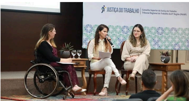
Foto 5: O "VIII Encontro Nacional de Sustentabilidade da Justiça do Trabalho - identidades, trilhas e horizontes", realizado pelo Conselho Superior da Justiça do Trabalho, em parceria com o Tribunal Regional do Trabalho da Oitava Região (PA/AP) debateu, em seu primeiro painel

"Capacitismo e Barreiras Sociais no Ambiente de Trabalho", sobre a inclusão no mercado de trabalho ressaltando a importância da transformação estrutural para a garantia da acessibilidade.