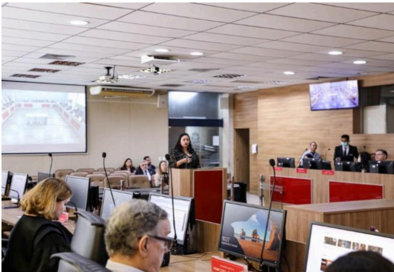
Foto 2: Com o intuito de reforçar a importância e chamar atenção para a causa do Transtorno do Espectro Autista (TEA), o Tribunal Regional do Trabalho da 8ª Região (PA/AP) abriu a sessão plenária realizada no dia 03 de abril, dando ênfase para o Dia Mundial de Conscientização do Autismo, celebrado no dia 02/04.