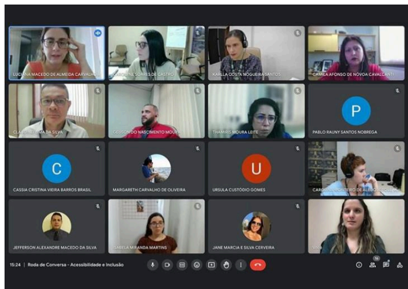
Foto 3: Desde a sua criação, o Subcomitê de Acessibilidade e Inclusão realiza rodas de conversas com equipes e gestores para conversar sobre temas relacionados à inclusão e participação de pessoas com deficiência no ambiente de trabalho. Em 2023, foram realizadas duas rodas de conversa nos meses de maio e junho, a partir da posse de

novos servidores com deficiência. As rodas têm permitido espaços de troca de conhecimentos, experiências e dúvidas sobre o tema, buscando-se encontrar soluções e possibilidades dentro de cada realidade.